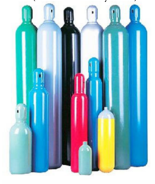
جزئیات انواع مدل ها در پشت صفحه

آدرس: تهران، خیابان مطهری، خیابان لارستان، خیابان افتخاری نیا پلاک ۱۲ واحد ۱۲